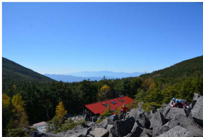
▲ 南アルプスの山並